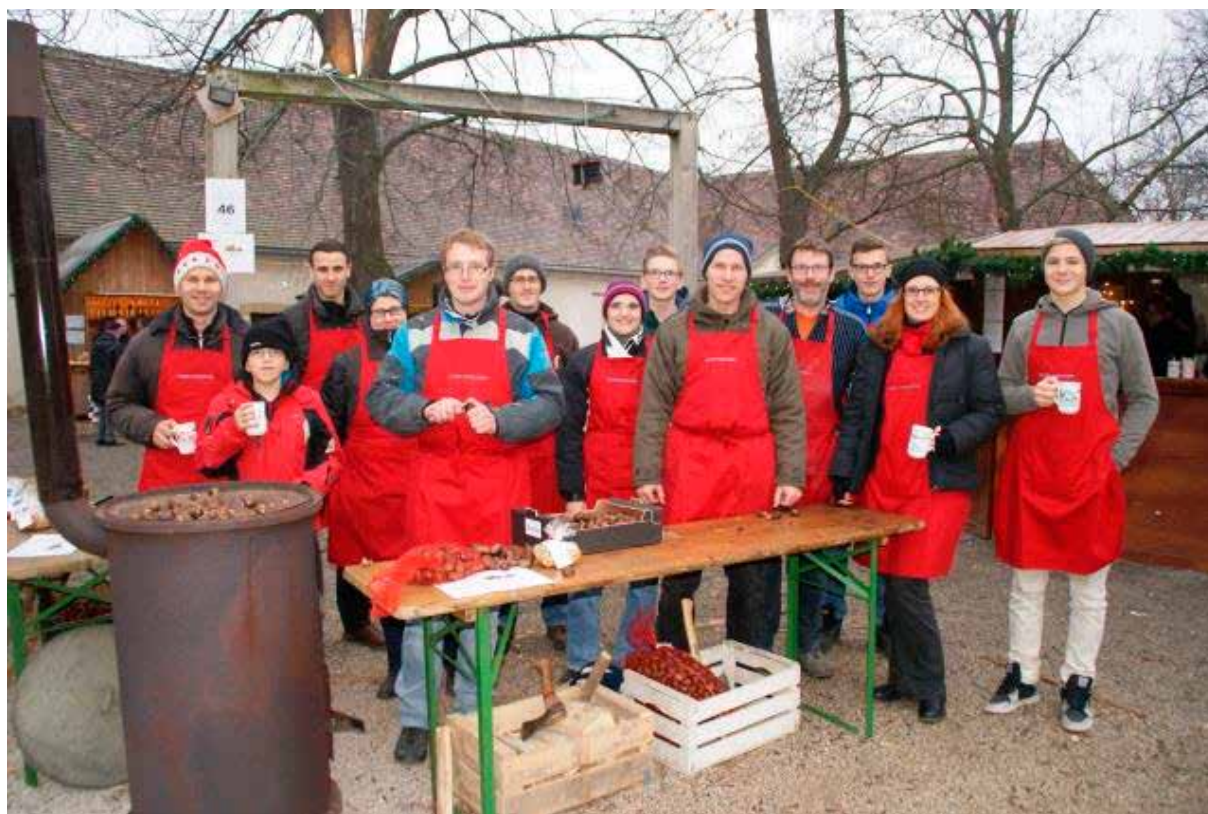
Gute Stimmung bei den Stndlern und Helfern beim „Advent im Schloss Kirchstetten“

Tausende Besucher forderten die vielen Standler und Mitarbeiter der Arbeitsgruppe „Advent im Schloss Kirchstetten“. Gelobt wurde das Krippenspiel der Volksschule Neudorf am Samstag, am Sonntag stimmten die Musikschüler bei einem Konzert in der Kirche die Besucher auf das bevorstehende Weihnachtsfest ein.