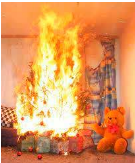
Vorsicht bei trockenen Christbäumen!