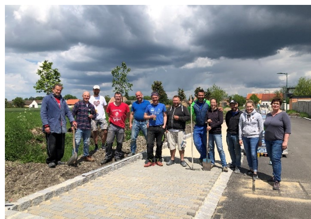
Freiwillige Helfer bei der Pflasterung in der Bauhofstraße

Gartenstraße: Der Bau der Gartenstraße ist im Herbst geplant. Derzeit läuft die Vorbereitung der Ausschreibung der Arbeiten.