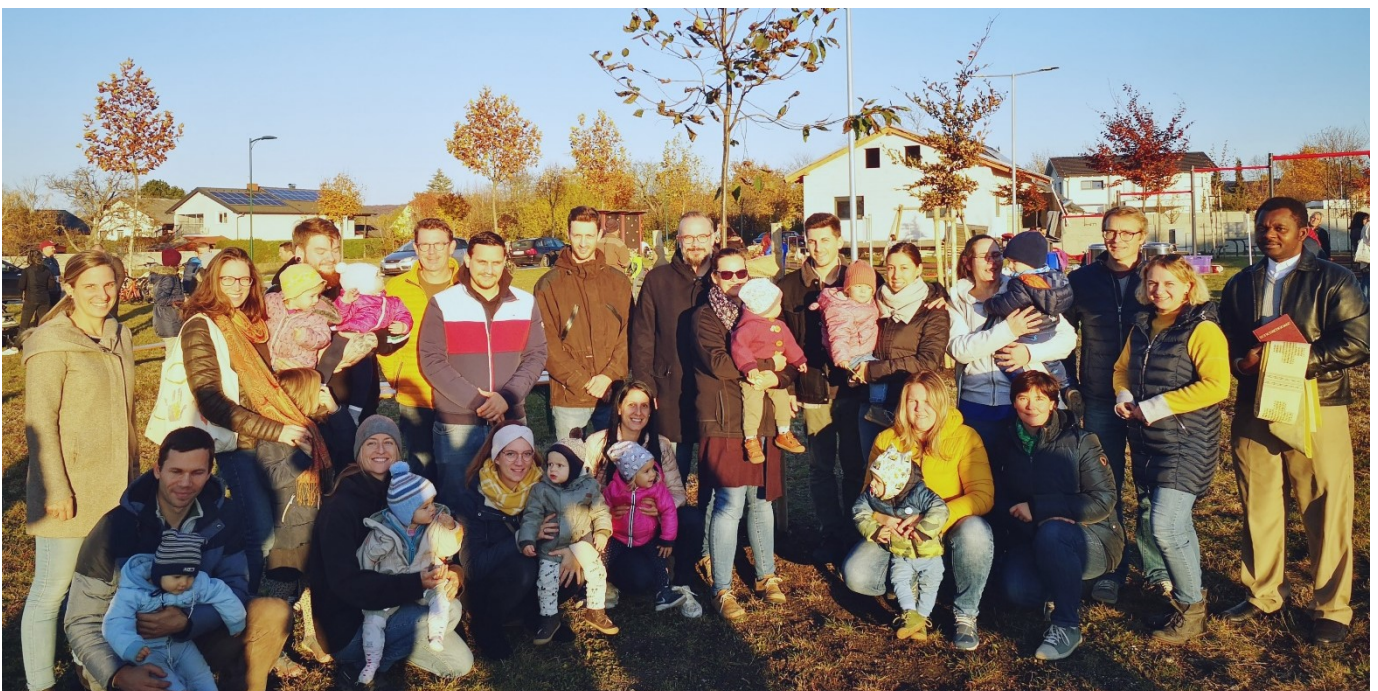
Eltern und Kinder des Jahrganges 2020