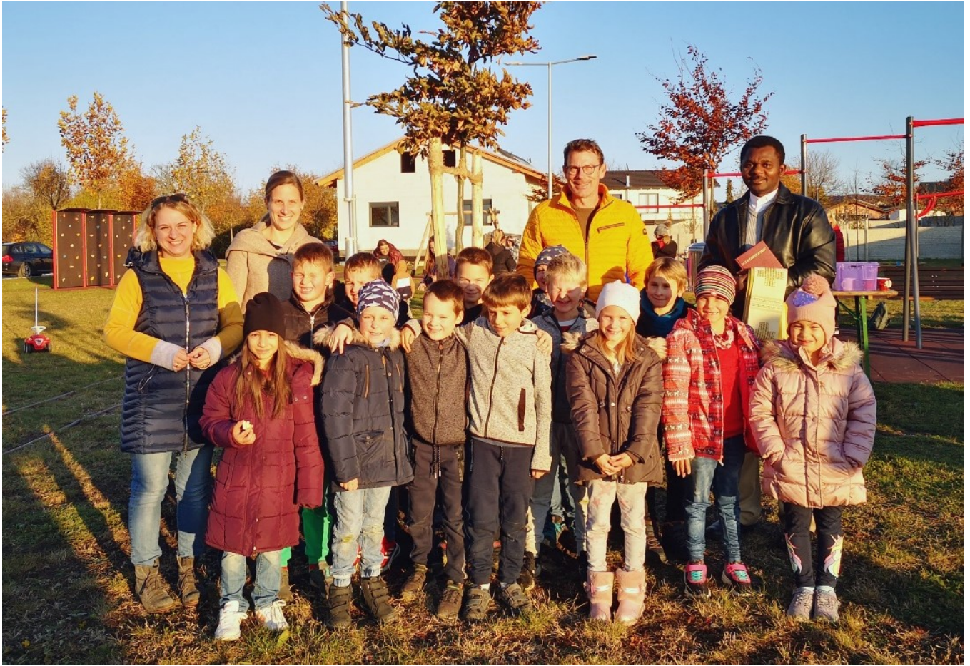
Eltern und Kinder des Jahrganges 2014