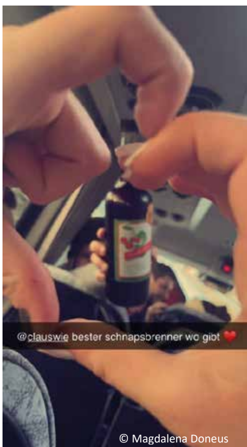
@clauswie bester schnapsbrenner wo giot ❤️